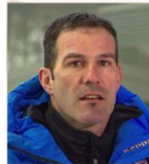
Armin Zöggeler Sport