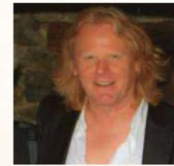
Martin Geier Naturfotograf