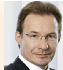
Michael Macht Porsche und VW