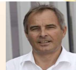
Erich Gummerer Techno Alpin