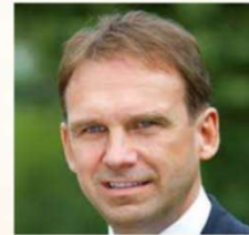
Dieter Althaus Politik